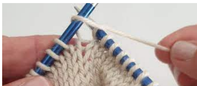
TEJIDO A DOS Y 5 AGUJAS (para medias y piezas tubulares)